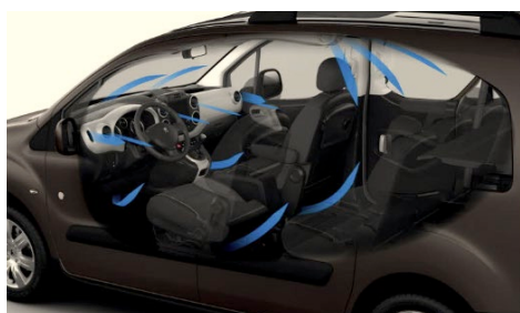
KLIMATYZACJA AUTOMATYCZNA DWUSTREFOWA