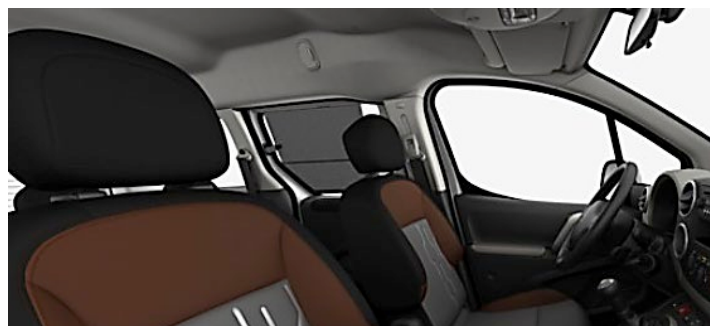
PAKIET BEZPIECZEŃSTWA DZIECI

Dla silnika 1,6 BlueHDi 100 KM – Tepee 5-osobowy.