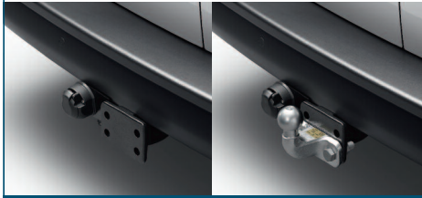
HAK HOLOWNICZY BEZ ZACZEPU / ZACZEP KULOWY