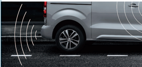
SYSTEM WSPOMAGANIA PARKOWANIA TYLNY