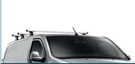
BELKA DACHOWA (POJEDYNCZA)