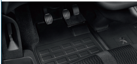
KOMPLET PRZEDNICH DYWANIKÓW GUMOWYCH Z LOGO PEUGEOT