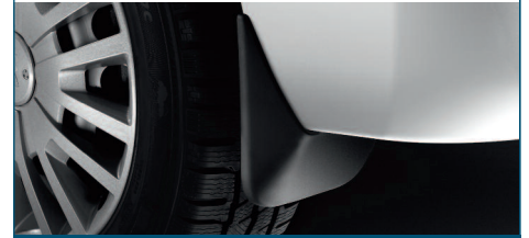
OSŁONY PRZECIWBŁOTNE TYLNE