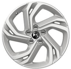
Felgi aluminiowe 17" BERLIN