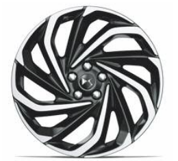
Felgi aluminiowe 19" Tall&Narrow AMSTERDAM