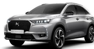
GRIS ARTENSE metalizowany