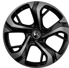
Felgi aluminiowe 18" GENEVE