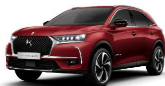
ROUGE ABSOLU perłowy