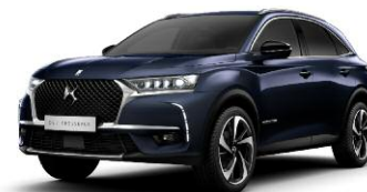
BLEU ENCRE perłowy