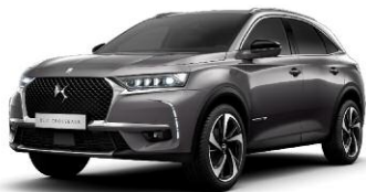
GRIS PLATINIUM metalizowany