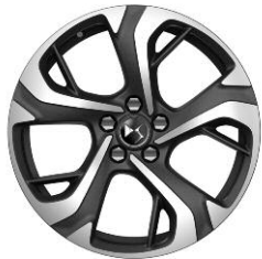
Felgi aluminiowe 18" BUENOS AIRES