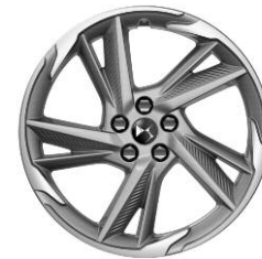
Felgi aluminiowe 19" ROMA