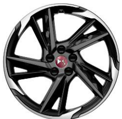
Felgi aluminiowe 19" BEIJING