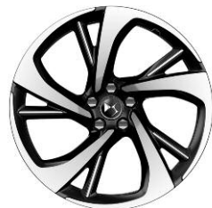
Felgi aluminiowe 20" TOKYO (BANGKOK)