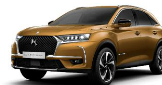
OR BYZANTIN perłowy