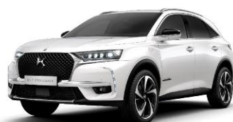
BLANC NACRE perłowy