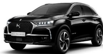
NOIR PERLA NERA perłowy