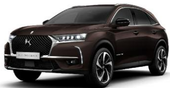
BRUN ANDRADITE perłowy