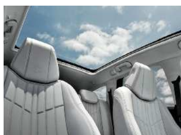
DACH PANORAMICZNY CIELO