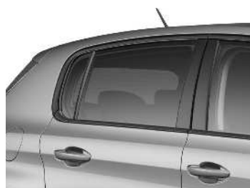
PRZYCIEMNIANE SZYBY TYLNE