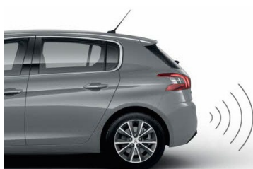
CZUJNIKI PARKOWANIA Z TYŁU