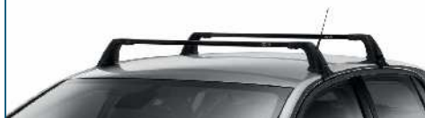
BELKI POPRZECZNE BAGAŻNIKA DACHOWEGO