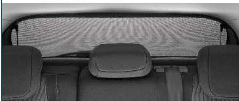
ZASŁONA PRZECIWSŁONECZNA TYLNA