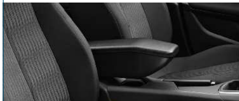
PODŁOKIETNIK ŚRODKOWY ZE SCHOWKIEM