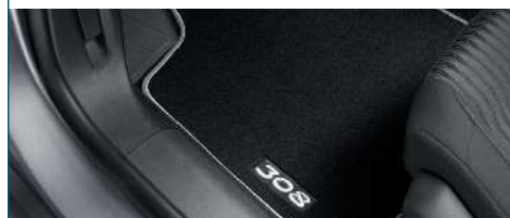
KOMPLET DYWANIKÓW MATERIAŁOWYCH