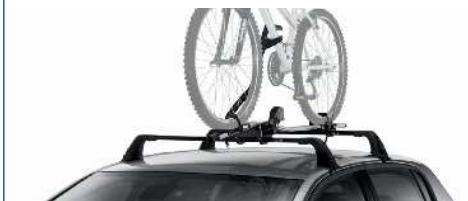
UCHWYT NA ROWER PRORIDE