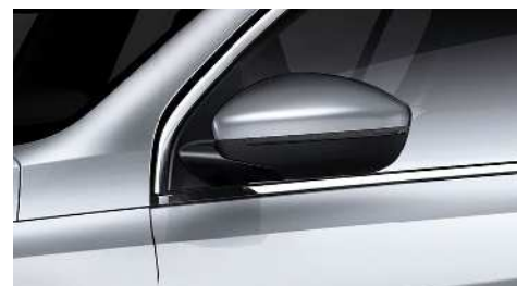
LUSTERKA BOCZNE SKŁADANE ELEKTRYCZNIE