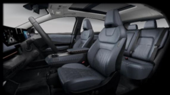
OPCJA DODATKOWO PŁATNA – 7 000 zł Niebiesko-szara [Z] (skóra Nappa i skóra ekologiczna**)