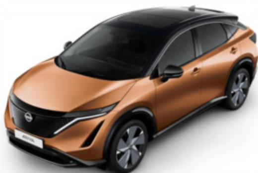
Miódziany metalizowany AKATSUKI + czarny dach + lusterka [XGJ]

Lakier metalizowany / perłowy + dach i lusterka w kolorze czarnym – 5 900 zł