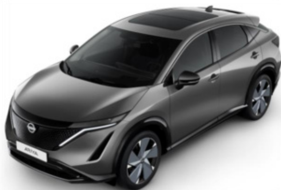
Szary metalizowany [KAD]