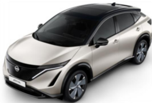
Srebrny metalizowany + czarny dach + lusterka [XGV]