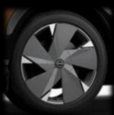
20" felgi ze stopu metali lekkich z nakładkami aerodynamicznymi (opcja dla "VGI VF") – 6 000 zł