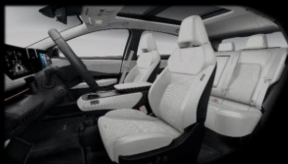
Kremowa [K] (welur perforowany i częściowo skóra ekologiczna**)