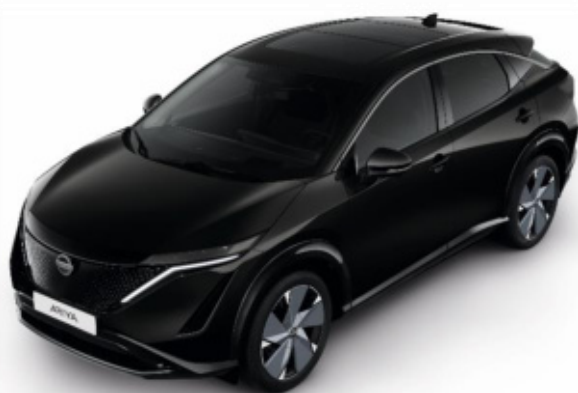
Czarny perłowy [CAT]

Lakier metalizowany / perłowy (jednokolorowe nadwozie) – 3 900 zł