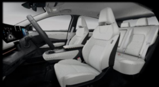
Kremowa [K] (materiał i częściowo skóra ekologiczna**)