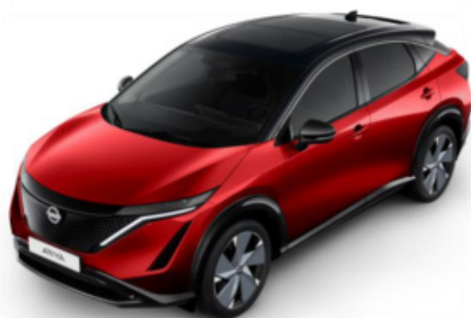
Czerwony metalizowany + czarny dach + lusterka [XGD]