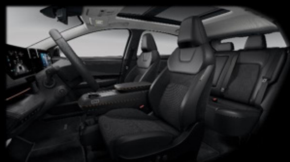
Czarna [G] (welur perforowany i częściowo skóra ekologiczna**)