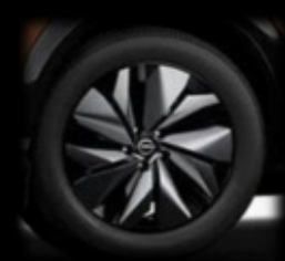
19" felgi ze stopu metali lekkich z nakładkami aerodynamicznymi