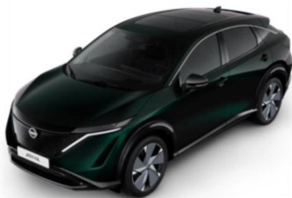
Zielony perłowy AURORA [DAP]