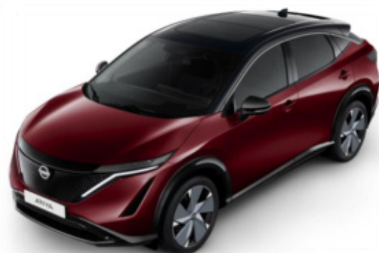
Burgundowy metalizowany + czarny dach + lusterka [XGG]