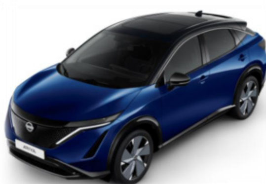
Niebieski perłowy + czarny dach + lusterka [XGU]