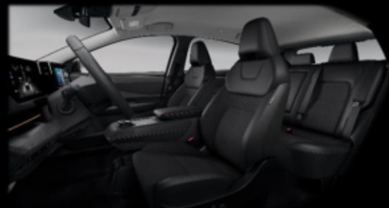
Czarna [G] (materiał i częściowo skóra ekologiczna**)