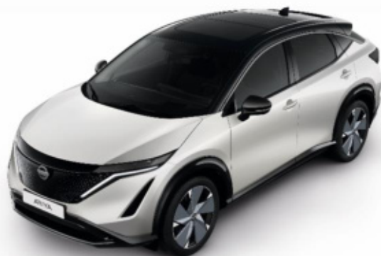
Biały perłowy + czarny dach + lusterka [XGA]