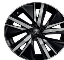
19" 'San Francisco'