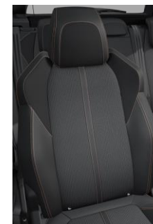
Tapicerka półskórzana Belomka Mistral