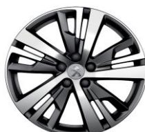
18" 'Detroit' Onyx Black