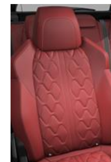
Tapicerka skórzana Nappa Rouge