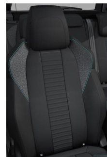
Tkanina Pneuma Mistral