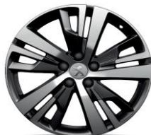
18" 'Detroit' Storm Grey