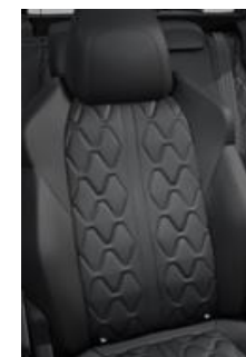
Tapicerka skórzana Nappa Mistral