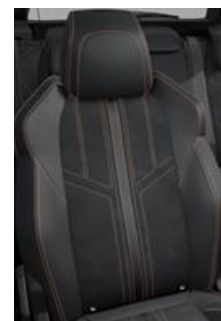
Tapicerka półskórzana Mistral + Alcantara