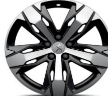
18" 'Los Angeles'