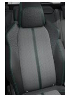
Tapicerka półskórzana Colyn Mistral