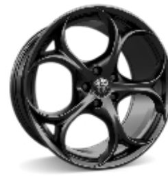
19" Felgi aluminiowe Modale Dark Kod opcji 3CV