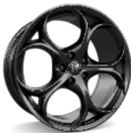
19" Felgi aluminiowe Modale Dark Kod opcji 3DB