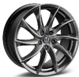
18" Felgi aluminiowe Sport Silver Matt Kod opcji 3CO

Oznaczenia w cenniku: podane kwoty w zł z VAT / ■ wyposażenie standardowe / - wyposażenie niedostępne / P wyposażenie dostępne w pakiecie