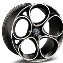
19" Felgi aluminiowe Sport Design Dark Glossy Kod opcji 3CX