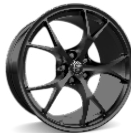
19" Felgi aluminiowe Exclusive Dark Kod opcji 3DA