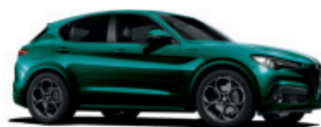
398 ZIELONY SPECJALNY - MONTREAL GREEN