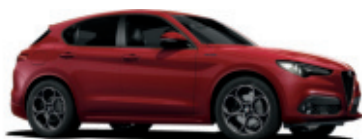
414 CZERWONY - ALFA RED