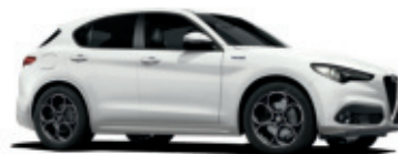
217 BIAŁY - ALFA WHITE