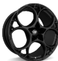
21" Felgi aluminiowe Modale Dark Kod opcji 3EQ