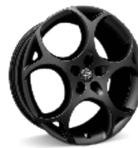
21" Felgi aluminiowe Modale Dark Kod opcji 3ET