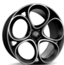
20" Felgi aluminiowe Sport 2 Dark Glossy Kod opcji WRD