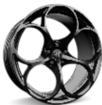
20" Felgi aluminiowe Sport 2 Dark Glossy Kod opcji 3EN