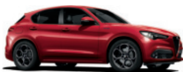
645 CZERWONY SPECJALNY - ETNA RED