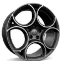
19" Felgi aluminiowe Sport Silver Matt/ Grey Kod opcji 3DY

Oznaczenia w cenniku: podane kwoty w zł z VAT / ■ wyposażenie standardowe / - wyposażenie niedostępne / P wyposażenie dostępne w pakiecie